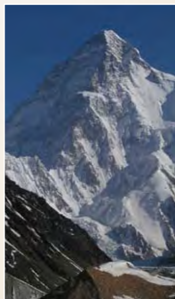
Jasemba 7.350 m